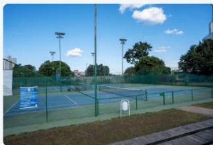
Quadras de Tênis