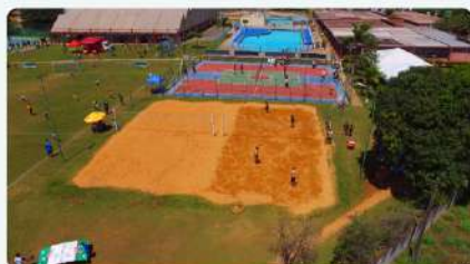
Futevôlei e Beach Tennis