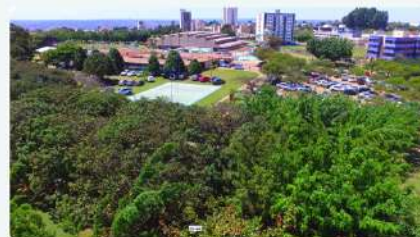
Muita Área Verde

A premiação acontecerá nos moldes dos anos anteriores, ou seja, serão premiadas as quatro melhores equipes da serie Ouro, Prata, Bronze e Extra.