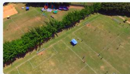
Campos de Futebol